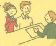
建築士による住宅相談