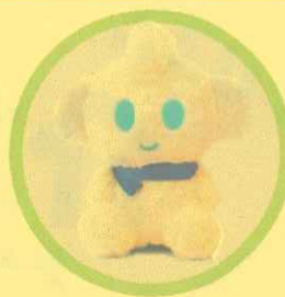
「Chapit(チャピット)」 (株)レイトロン