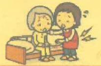
抱え上げない介護体験