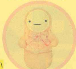
「スマイビ S」 (株)東郷製作所