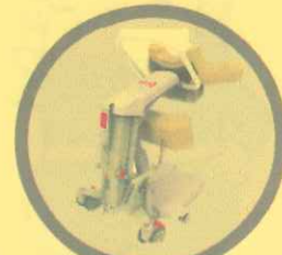
移乗支援ロボット「Hug」 (株)FUJI