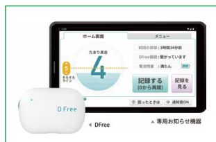
排尿予測デバイス 「DFree」 (株)フロンティア