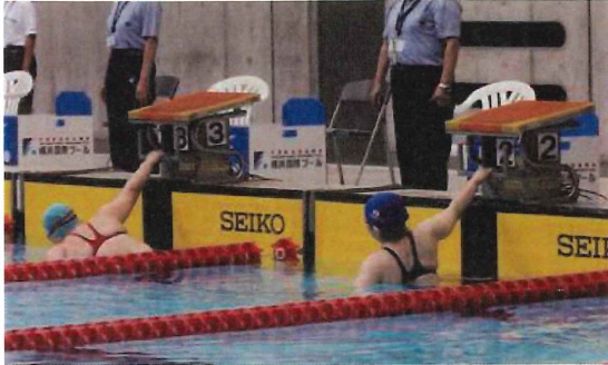
自由形の水中スタート

クラスに関係なく、水中からのスタートやスターティングブロックの横からのスタートも認められます。バランスや協調性に障がいのある選手については、チームスタッフがスタート合図まで支えることや、スターティングブロック上に上がる際に介助することなども認められています。