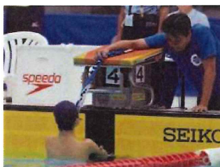
両上肢欠損の選手の器具を使ったスタートの一例。介助者がタオルの端を持ち、もう一端を選手が口でくわえます