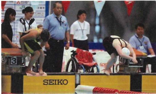
スターティングブロックの横から飛び込む選手の選手