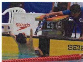
くわえたタオルを離すことで一気にスタート

ターティンググリップを両手で握るといった基本ルールがありますが、手部や上肢の切断・欠損、麻痺などが理由でできない場合には、片手で握ることや、器具を使用してスタートすることが認められる場合があります。