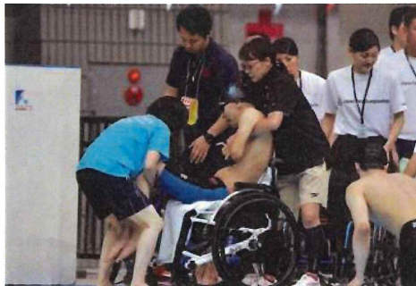
入退水の介助の様子

IPCの主催する主要な大会では、棄権についてもパラ水泳特有のルールがあります。棄権は医学的理由によってのみ認められ、所定の用紙に理由等を記載し、医師または理学療法士の署名を必要とします。この手続きを経ずに当該レースに出場しなかった場合には、罰金が科せられます。