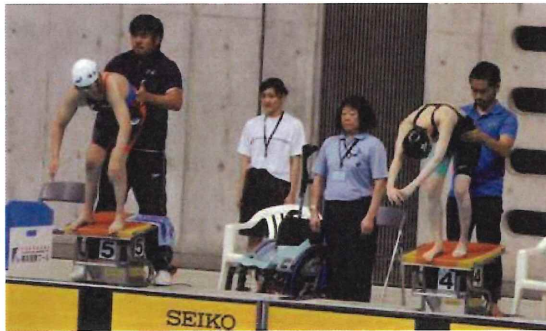
チームスタッフが身体を支えた状態でスタート

プールへの入水および退水についても、介助を必要とする選手がありますが、これもクラス分けの際に確認されます。タッパーやスタート介助、入退水介助の必要な選手は、その役割を担うスタッフとともにレースに入場してことになります。