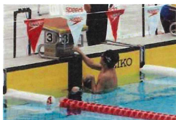
左手に麻痺があるため、右手でスターティンググリップを握っています

パラ水泳では、肢体不自由で10クラス(平泳ぎは9クラス)、視覚障がい3クラス、知的障がい1クラスの合計14クラスが存在します。