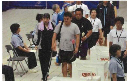
タッピングバーを持ったスタッフと一緒に入場してくる視覚障がいの選手たち