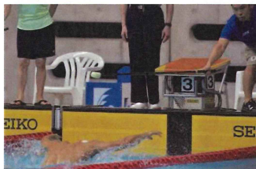
ゴールやターンの際に壁が近づいてきていることを選手に伝えるタッピング。選手と介助者が練習を重ねてタイミングを合わせます

視覚障がいのある選手が競技する際に、選手の身体を棒などで触れることで、壁が近づいたことを知らせますが、これを「タッピング」と呼びます。合図する人はチームのコーチなどが務めますが、タッパーと呼ばれます。S11クラス(全盲)については、