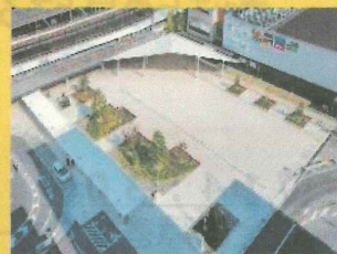
JR佐賀駅佐賀城口(南口)前